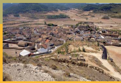
Castejón de Valdejasa