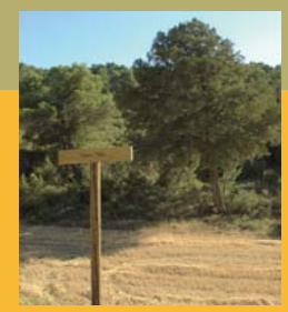
Sabina Mateo ( Juniperus thurifera )