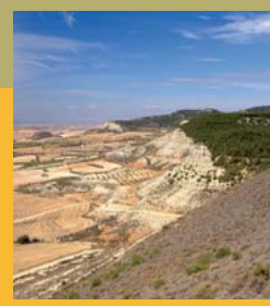
Vista desde el Santuario de Santa Ana